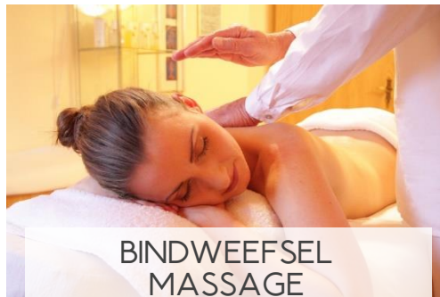
BINDWEEFSEL MASSAGE 1 DAG