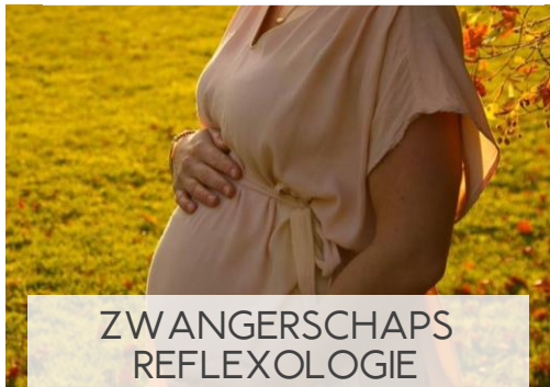
ZWANGERSCHAPS REFLEXOLOGIE 6 DAGEN / 20 ECTS