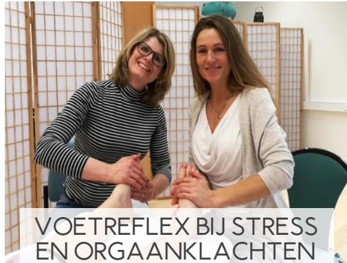
VOETREFLEX BIJ STRESS EN ORGAANKLACHTEN 10 DAGEN / 20 ECTS