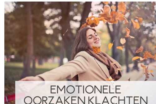
EMOTIONELE OORZAKEN KLACHTEN LESWEEKEND TEXEL