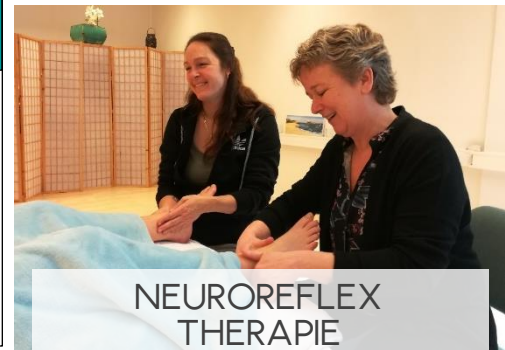
NEUROREFLEX THERAPIE 3 DAGEN

VRUCHTBAARHEID OVERGANG AFVALLEN ADHD EN AUTISME ZIEKTE VAN LYME