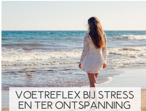
VOETREFLEX BIJ STRESS EN TER ONTSPANNING 2 DAGEN